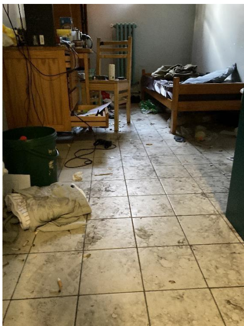
Figuur 7 Toestand van een cel van een gedetineerde die weigert zijn cel te onderhouden

Van gedetineerden wordt verwacht dat ze zelf zorgen voor de netheid van hun cel, maar niet alle gedetineerden zijn in staat om de eigen cel opgeruimd en proper te houden.